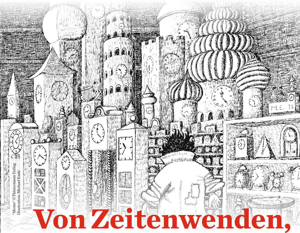
"Momo" ©Thienemann Verlag Illustration: Michael Ende