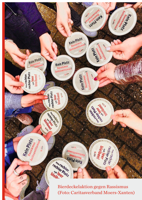
Bierdeckelaktion gegen Rassismus

André Stockmanns: Grundsätzlich arbeiten wir viel mit den Schulen im Verbandsgebiet zusammen. Mit den Mitarbeitenden im offenen Ganztage können wir schon Grundschulkindern erreichen. Zur diesjährigen interkulturellen Woche haben wir mit den Kindern aus dem offenen Ganztage in Rheinberg ein Banner gestaltet, das an einem